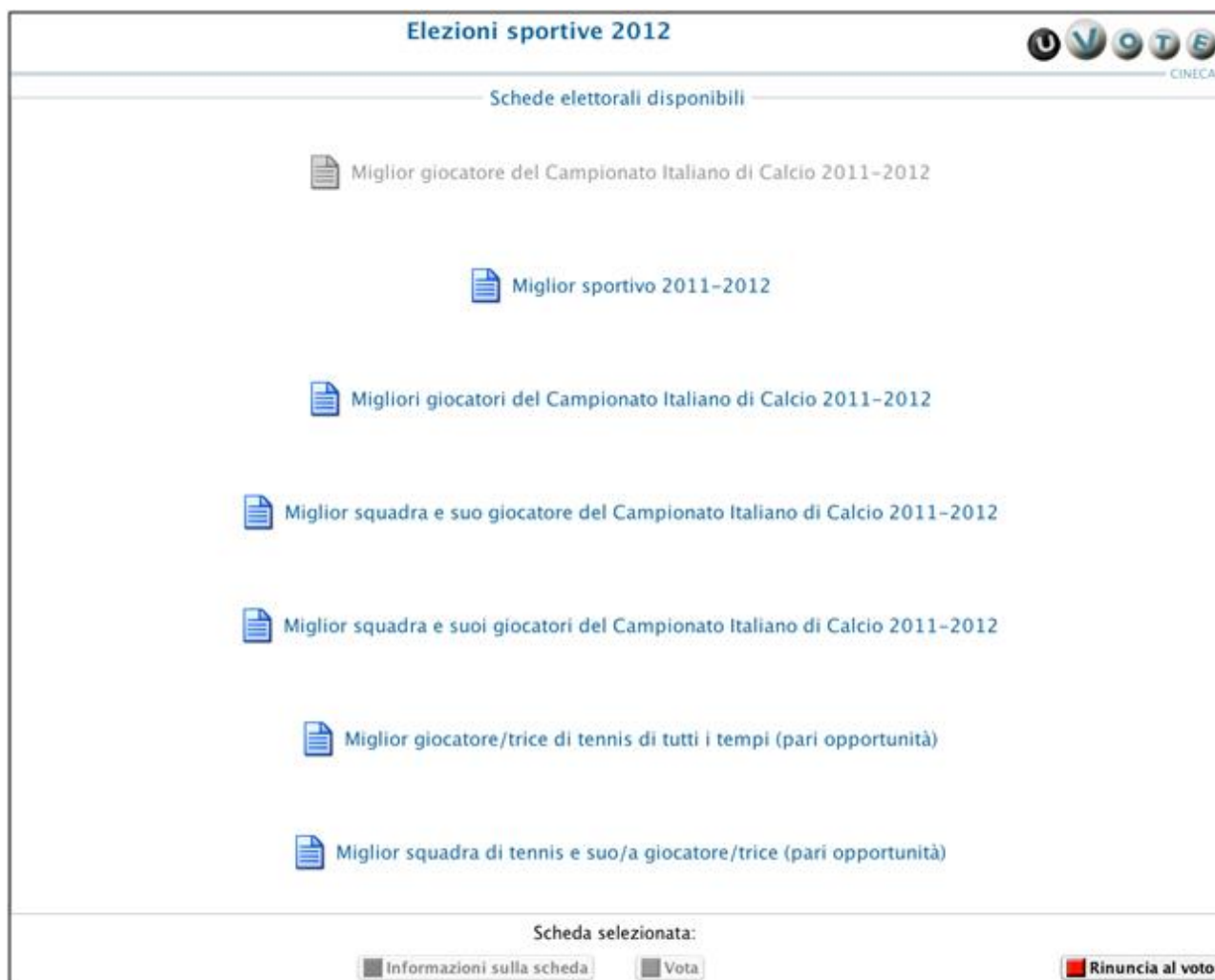
Figura 5: Elezione votata

Le elezioni per le quali sono già state espresse preferenze sono disabilitate, ossia sono di colore grigio e non selezionabili.