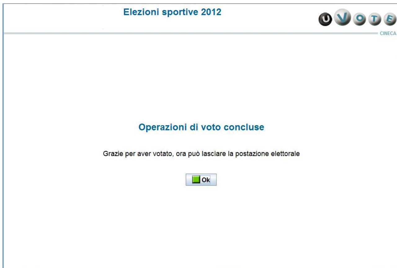
Figura14: Conferma fine operazioni di voto

Al termine delle operazioni di voto l'elettore deve premere il pulsante Ok .