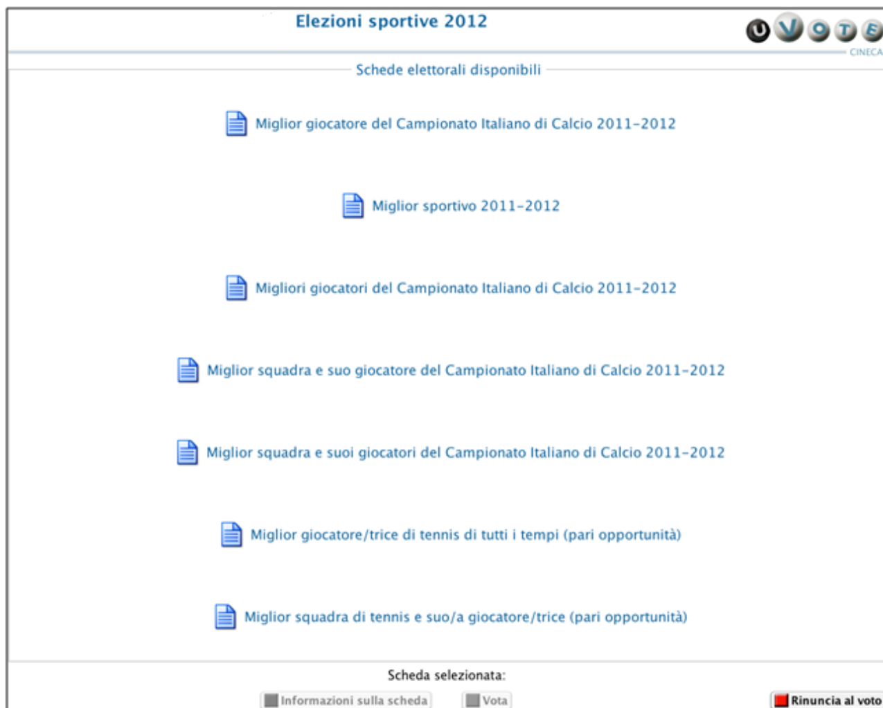
Figura 3: Interfaccia di selezione dell'elezione da votare

Dopo aver confermato la propria identità, l'elettore ha accesso all'elenco delle elezioni per le quali ha diritto di voto.