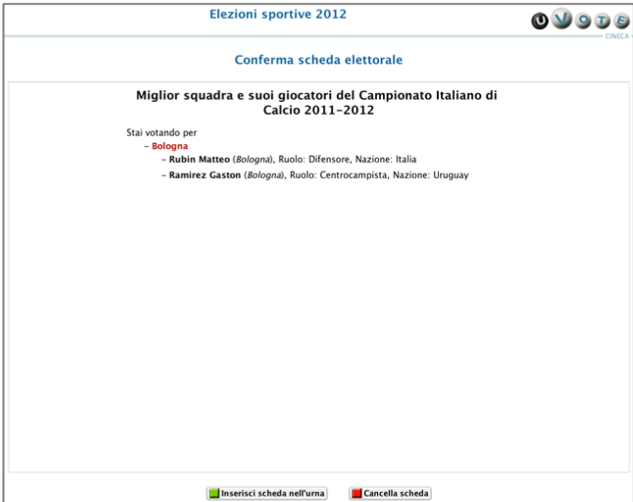
Figura11: Conferma preferenza espressa

L'elettore, qualora non voglia confermare la propria scelta, può selezionare Cancella scheda e tornare così a ripetere la scelta di lista e candidati.