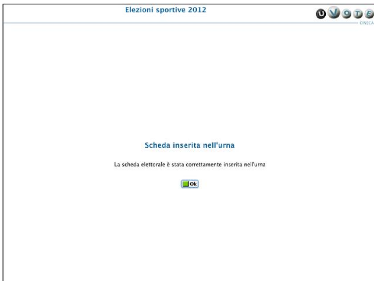
Figura12: Conferma inserimento scheda nell'urna

A seguito della pressione del pulsante Ok , il sistema mostra l'interfaccia di fine operazioni di voto nel caso in cui l'elettore abbia votato per tutte le elezioni disponibili, in caso contrario il sistema visualizza la lista delle elezioni disponibili .