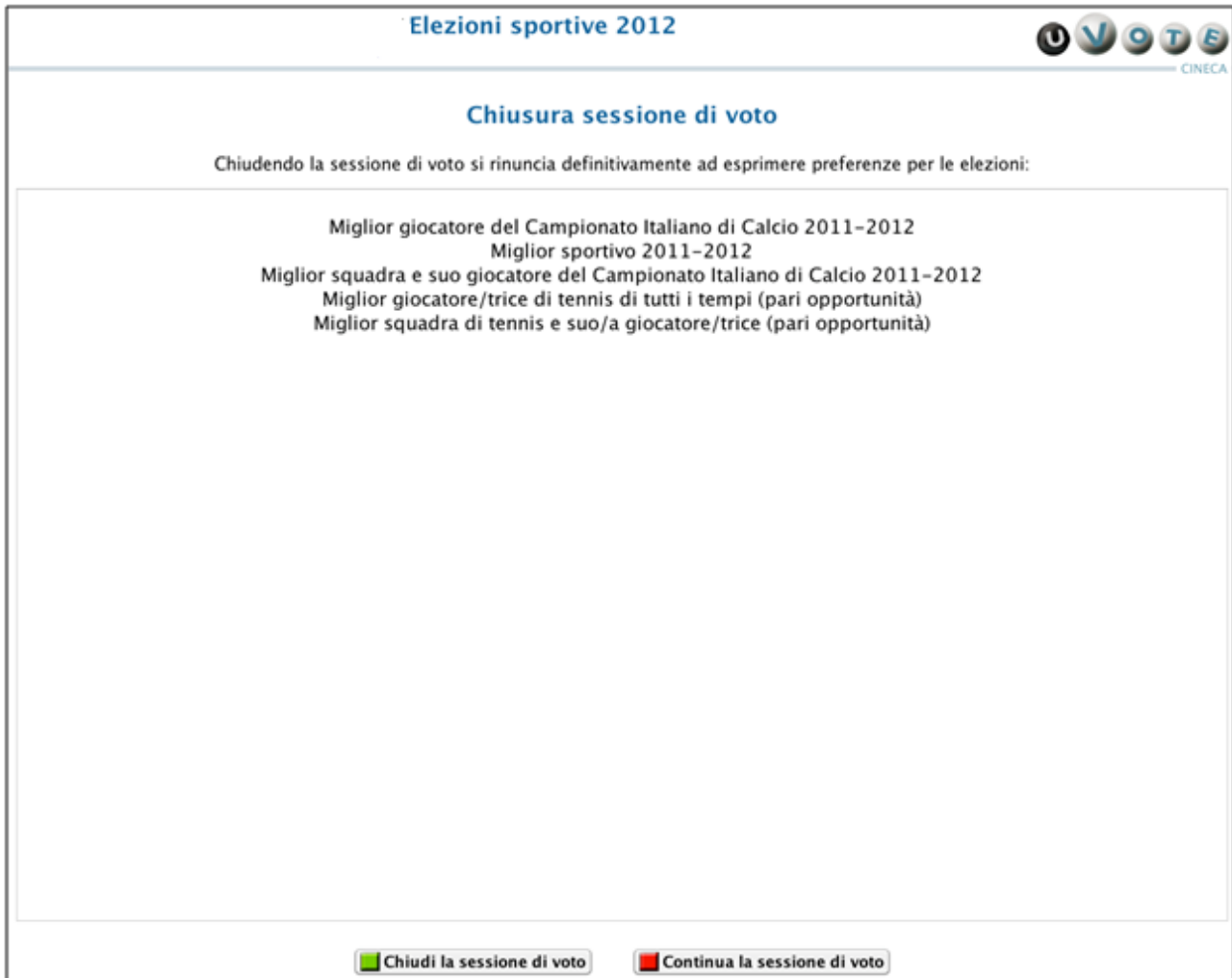
Figura13: Conferma rinuncia al voto

In questo caso il sistema mostra l'elezione o le elezioni per le quali l'elettore rinuncia definitivamente ad esprimere la propria preferenza.