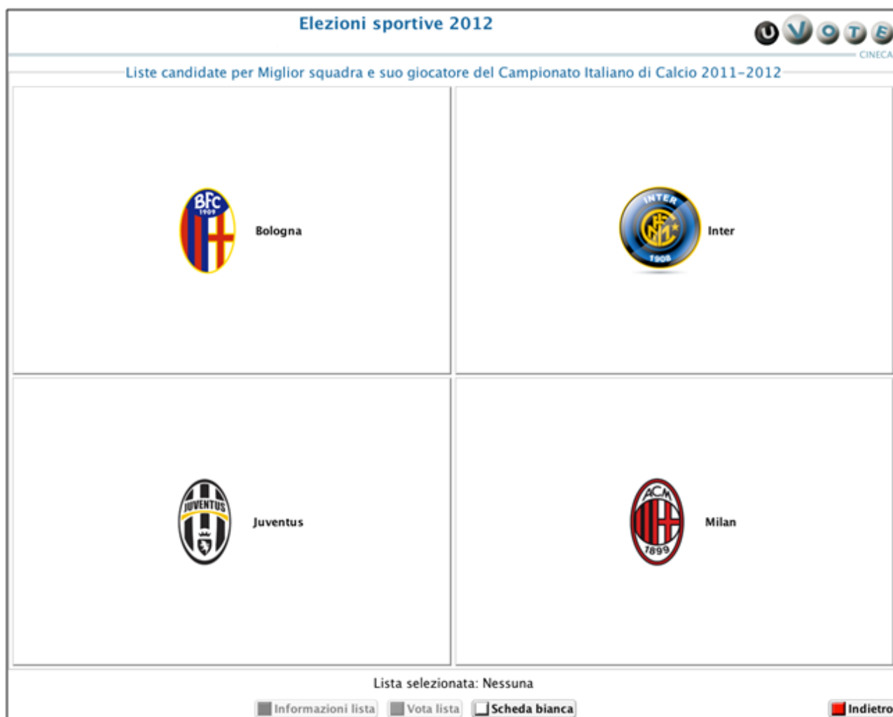
Figura 6: Liste candidate con elezioni multiple

L'elettore ha accesso ad una schermata che contiene l'elenco delle liste disponibili per l'elezione selezionata.