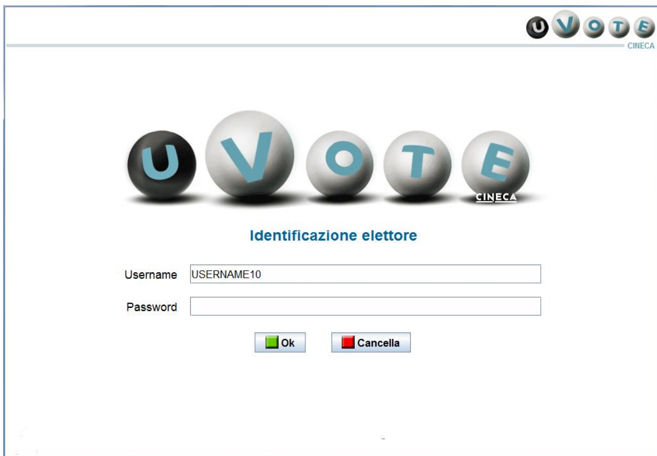
Figura 1: Identificazione presso l'applicazione di voto

L'elettore accede al sistema di voto autenticandosi con la coppia username e password precedentemente ricevuta.